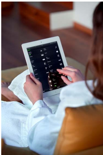
Bild: Connected Comfort