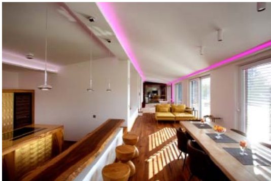
Bild: Connected Comfort Fotonachweis: U. Beuttenmüller für Connected Comfort